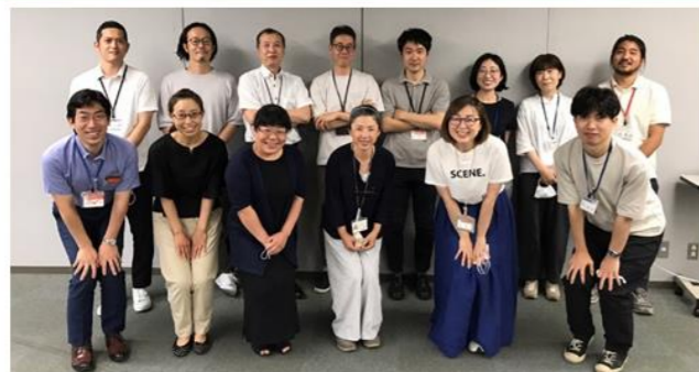
南区企画会議の様子