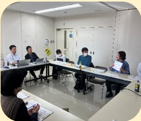
今年度の企画会議の様子