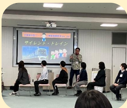
『令和6年度 堺区・西区で協働をすすめるためのソーシャルワーク研修』の様子①