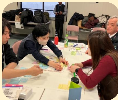
『令和6年度 堺区・西区で協働をすすめるためのソーシャルワーク修』の様子②