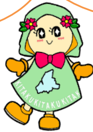
つながりイメージキャラクター つなっきー